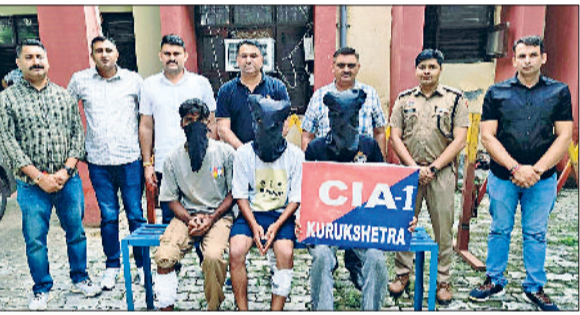
कुरुक्षेत्र। पुलिस की गिरफ्त में हमलावर।