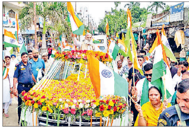
अंबाला। तिरंगा यात्रा में शामिल मंत्री अनिल विज व सड़कों पर उमड़ करिया कार्यकर्ताओं का सैलाब।

ऊर्जा, परिवहन एवं श्रम मंत्री अनिल विज ने कहा कि देश भक्ति की भावना जब लोगों में पूरी तरह से हुंकार लेने लगे तो बड़े-बड़े देश के दुश्मन डरकर भाग जाते हैं। देश आजादी की वर्षगांठ मनाने जा रहा है। हमारी पार्टी ने सारे देश को तिरंगाभक्त करने के लिए हर शहर व प्रदेश में तिरंगा यात्रा निकालने का कार्यक्रम तय किया है। उन्होंने कहा कि इसी क्रम में अंबाला छावनी में निकाली तिरंगा यात्रा में बड़ी संख्या में लोग शामिल हुए। वे देश भक्ति की धुनों में जमकर झूमे। विज स्वतंत्रता दिवस के उपलक्ष्य पर अंबाला छावनी में निकाली गई विशाल तिरंगा यात्रा के उपरांत पत्रकारों से बातचीत कर रहे थे। इससे पहले विज के नेतृत्व में