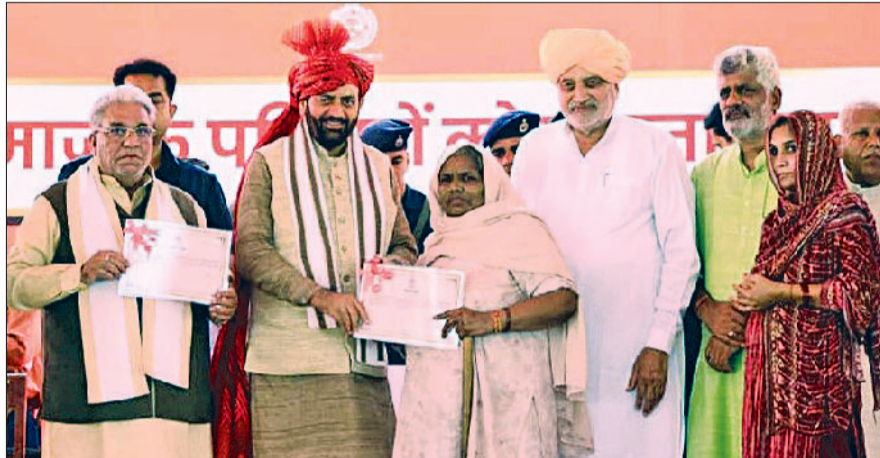
कुरुक्षेत्र। पात्रता परिणाम पत्र सौंपते मुख्यमंत्री नायब सिंह सैनी।