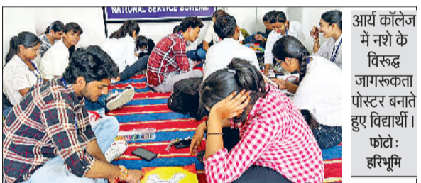
आर्य कॉलेज में नशे के विरुद्ध जागरूकता पोस्टर बनाते हुए विद्यार्थी।