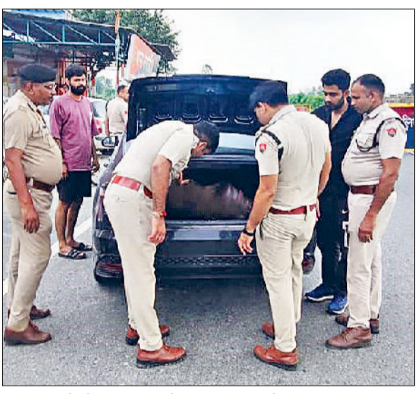
उत्तर प्रदेश की सीमा पर वाहनों की जांच करते हुए पानीपत पुलिस।