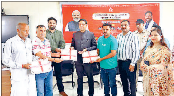
अंबाला। प्रजापति समाज के लोगों को सौंपे गए प्रमाण पत्र।