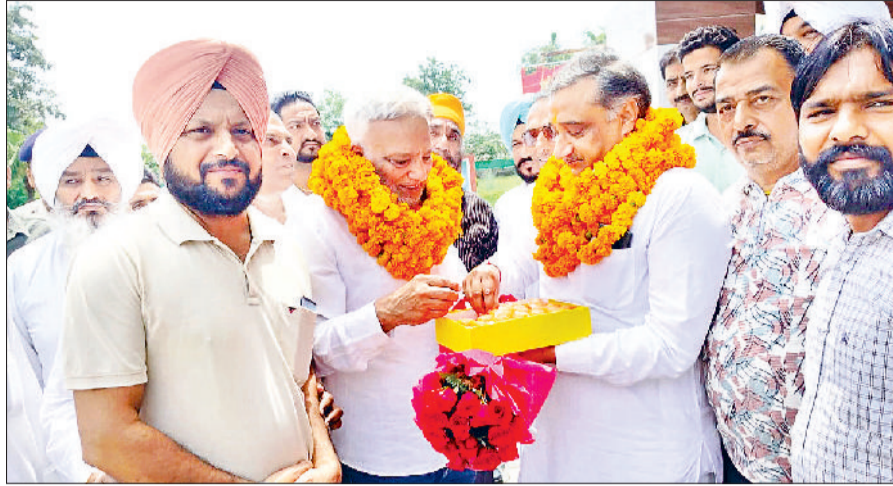
अंबाला। नवनियुक्त जिलाध्यक्ष पवन अग्रवाल व विधायक निर्मल सिंह का अभिनंदन करते कार्यकर्ता।

■ अंबाला की समस्याएं, महंगाई, टूटी सड़कों, जलभराव, प्रदूषण, बुनियादी ढांचे की कमी को लेकर आवाज बुलंद करेंगे