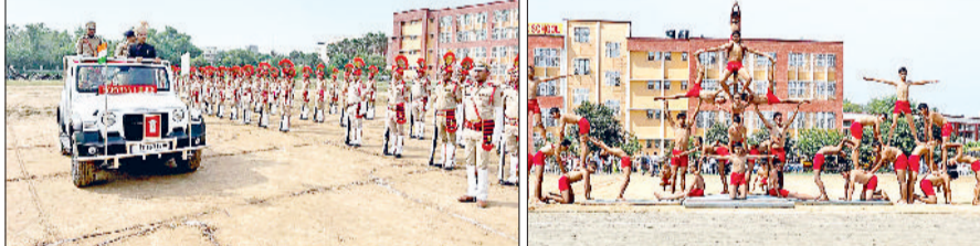
अंबाला। फाइनल रिहर्सल में परेड की सलामी लेते डीसी व मलखम की प्रस्तुति देते छात्र।