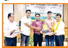
प्राचार्य सेमिनार के प्रतिभागियों को प्रमाण देकर सम्मानित करते हुए।